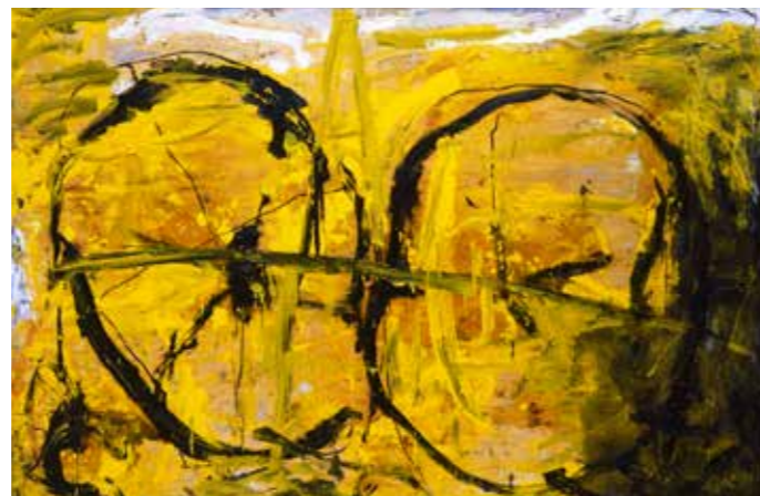
Helios, 1988 Öl auf Holz 170 × 250 cm

Eine eindeutige Erklärung für die Bedeutung dieses Zeichens hat er jedoch nicht hinterlassen. Auch enthalten seine Bilder keine Handlung, über die sich eine unmittelbare Bedeutung erzählerisch nachvollziehen ließe. Schumacher lässt den Betrachtern seiner Bilder die Freiheit, eine eigene Interpretation zu finden. Er lenkt jedoch den Blick auf einen Gegenstand, der ihn selbst zeitlebens interessiert hat. Dies zeigt gerade auch der Vergleich von Früh- und Spätwerk. Das Rad findet sich darin monumental als Einzelmotiv und häufiger noch eingebettet in Landschaften, die auch im Zusammenhang mit der Tradition der Bukolik in der Malerei stehen. Im Spätwerk trat das Motiv 1988 nach fast vier Jahrzehnten der reinen Abstraktion gewissermaßen aus dem