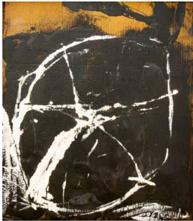
Nera , 1989 Öl auf Karton 78,5 x 70,5 cm

Es sind nur wenige Hauptmotive, die der Maler immer wieder setzt. Diese Motive – Häuser, Leitern, Figuren und Tiere sowie nicht zuletzt Räder – sind dabei nicht als persönliche Ausprägung einer Symbolsprache zu verstehen. Die reduzierten Figurationen Schumachers, denen kein erzählerisches Moment zugrunde liegt, rufen vielmehr überzeitlich gültige menschliche Ur-Erfahrungen wach.