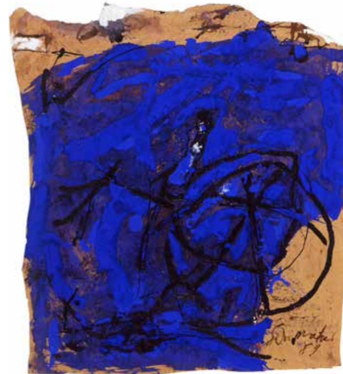
GB-26/1989, 1989, Gouache auf braunem Packpapier, 57 × 52 cm

tion, die er für seine Arbeit brauchte. So stehen in Früh- und Spätwerk des Malers immer wieder Landschaften und damit verbundene Motive im Mittelpunkt, die der naturverbundene Künstler aus inneren Bildern schöpfte. Auch innerhalb der gestisch-abstrakten Werkabschnitte lassen sich Annäherungen an Landschaftliches ausmachen, die jedoch weniger als Abbild der realen Welt, sondern vielmehr als ein Echo aus dem Inneren des Künstlers zu verstehen sind. Die Figurationen des Spätwerks entsprechen der zeichnerischen Handschrift der frühen, dem Expressionismus nahestehenden Arbeiten. Sie sind in ihrer hohen Konzentriertheit allerdings erkennbar durch die jahrzehntelange abstrakte Malerei geprägt und wären ohne diese Entwicklung im Gesamtwerk Schumachers nicht vorstellbar.