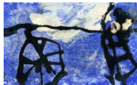
GH-1/1999, 1999 Tuschzeichnung 12,5 × 21 cm

Emil Schumacher zog es immer wieder in die Natur, die ihm Muße und Erholung bot – hier fand er die Inspira-