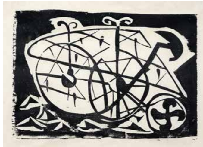
Egge , 1951 Holzschnitt 25,5 x 36,5 cm auf 35 x 50 cm

Das Rad kann dennoch verstanden werden als Sinnbild für Arbeit und Technik. Mit dem technischen Bildgegenstand lenkt Emil Schumacher den Blick auf das Verhältnis des Menschen – also auch sein eigenes – zur Natur. Denn durch Erfindungskraft und Werk unterscheidet der Mensch sich von allen anderen Geschöpfen. Schumacher, der 1912 geboren wurde und zwei Weltkriege